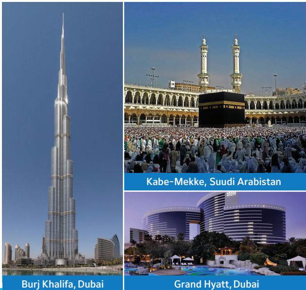
Burj Khalifa, Dubai

1874 yılından bu yana York® markası olarak, sunduğumuz geniş ürün yelpazesi ve kaliteli hizmetler ile daha işlevsel ürünler yaratarak soğutma ve ısıtma çözümlerine konfor ve pratiklik getiriyoruz. Dünyanın en meşhur binaları için ısıtma ve soğutma sistemleri tasarladık ve uyguladık. Bizim kalitemiz sizin yaşam kalitenizi artırır.